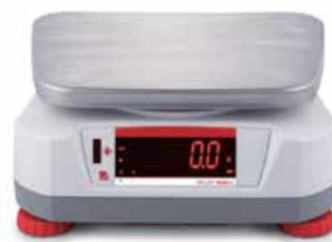
Afficheur arrière avec capteur sans contact intégré