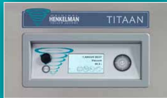
SYSTÈME DE CONTRÔLE AVANCÉ