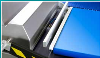
SYSTÈME AUTOMATIQUE INTÉGRÉ