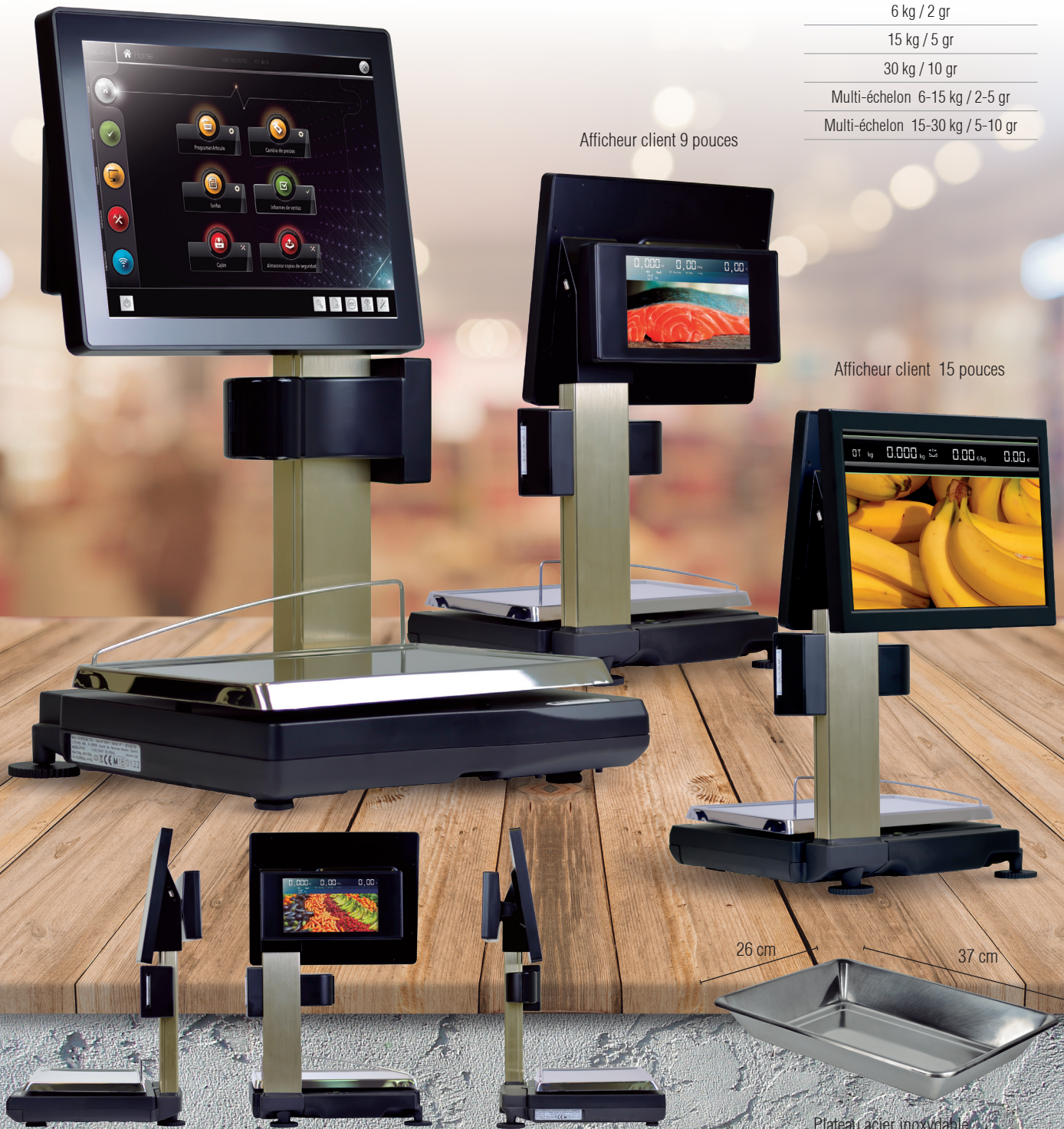
Plateau acier inoxydable