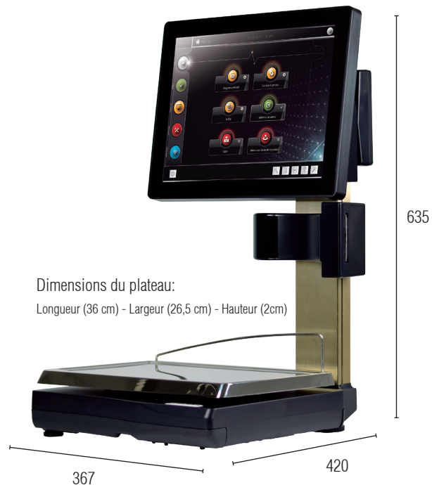
Dimensions du plateau: Longueur (36 cm) - Largeur (26,5 cm) - Hauteur (2cm)