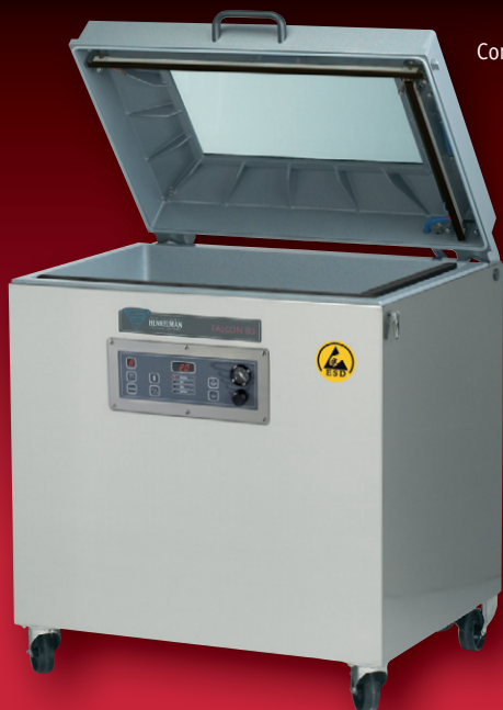
Photo: Falcon 80 Configuration ESD