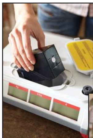
Activités mobiles avec la batterie rechargeable