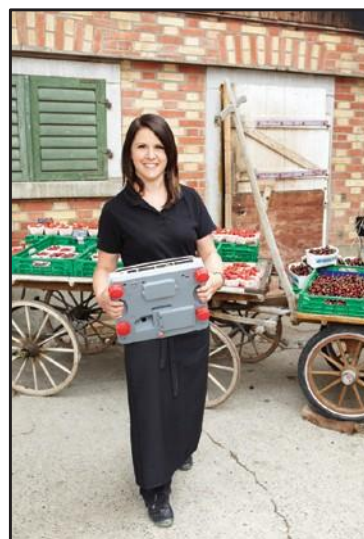
La balance est facile à transporter grâce aux deux poignées sous la partie inférieure