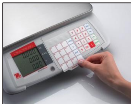
Carte préprogrammée remplaçable