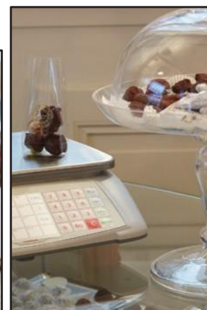
Bonbons, thé, chocolat