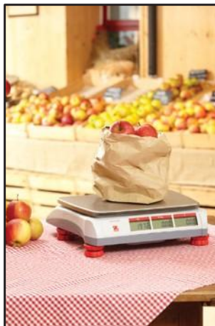
Marchés de fruits et légumes

L'Aviator 5000 est une balance poids/prix portable stylée, adaptée à une plage d'environnements poids/prix tels que les marchés, les entreprises mobiles ou de plus petits magasins spécialisés. Sa construction robuste mais néanmoins légère et son plateau en acier inoxydable de haute qualité améliorent ces types d'environnement dans lesquels l'hygiène alimentaire, la portabilité et la solidité sont essentielles. Associée à une technologie de pesage de haute qualité, l'Aviator constitue un investissement fiable à long terme. Grâce à son clavier ergonomique et à l'interface utilisateur simple, la balance est rapide et facile à utiliser, ce qui accélère le service clientèle dans toutes les applications.