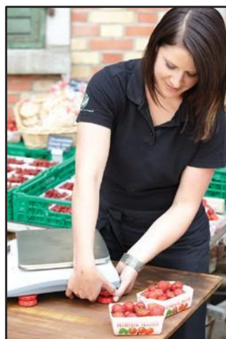
Pieds faciles à régler